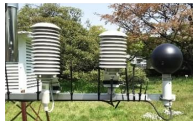
暑さ指数(WBGT)測定装置